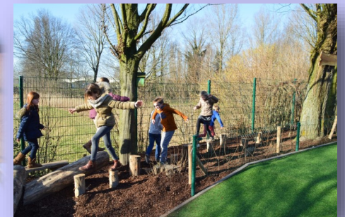
Leerlingen gemeenteschool testen 'overlevingspad' uit